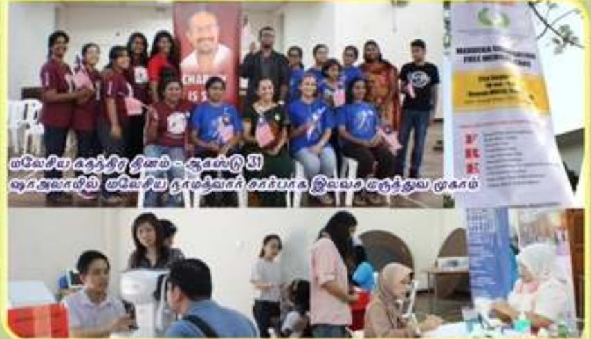
மலேசிய சுதந்திர தினம் - ஆசனாபுரி 31 ஷா அலாமின் மலேசிய நாமதீவகர் சார்பாக இவ்வசை மருத்துவ முகாம்