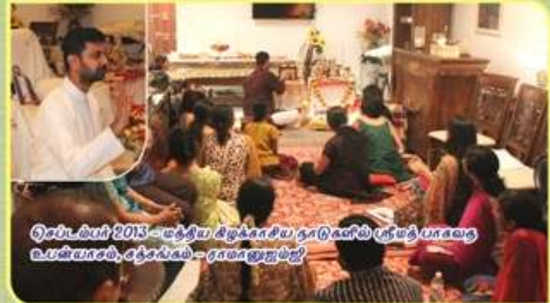
செப்டம்பர் 2013 - மத்திய கிழக்காசிய நாடுகளில் ஸ்ரீமத் பாகவத உபன்யாசம், சத்சங்கம் - ராமானுஜம்ஜி