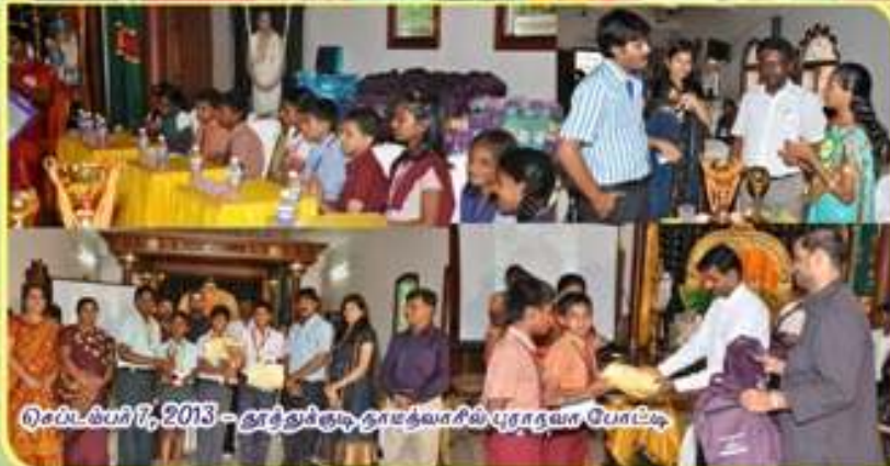
செப்டம்பர் 7, 2013 - தாதுக்குடி தாமதவாசில் புராணம், போட்டி