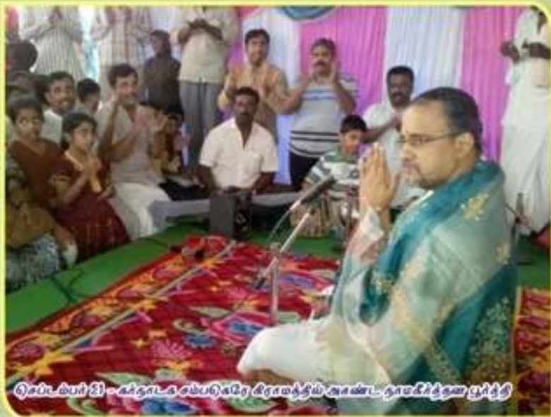
செப்டம்பர் 21 - கர்நாடக சம்பளிகரே சிராமத்திய அசண்ட - நாமகீர்த்தன பூர்த்தி