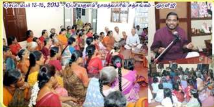
செப்டம்பர் 13-15, 2013 - பெரியநாள் தாமதவாசில் சத்சங்கம் - ஓரன்ஜி