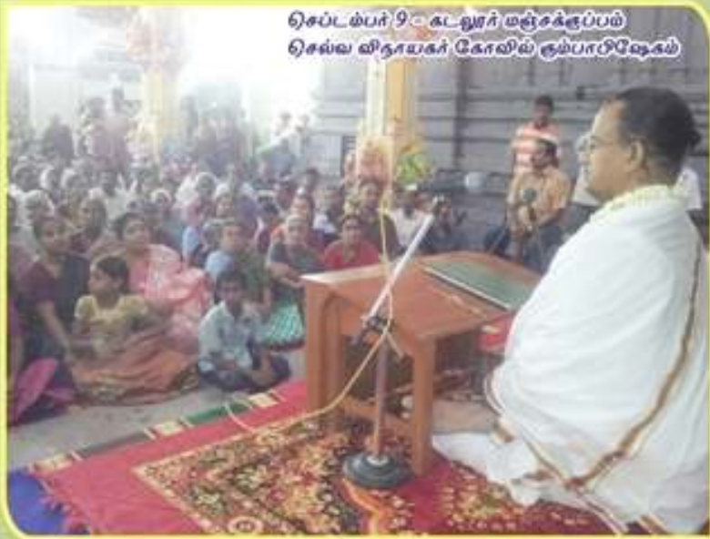
செப்டம்பர் 9 - கடலூர் மஞ்சளூர்ப்பய செல்வ விநாயகர் கோவில் சும்பாடுஷேகம்