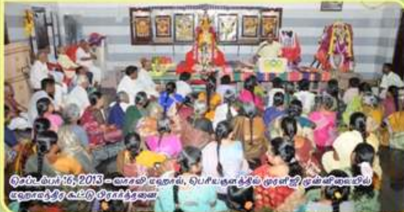
செப்டம்பர் 16, 2013 - வசலி மஹால், பெரியநாள் தீய ஓரன்ஜி/ஓன்ஸிவையில் மஹாதீர கட்டு பிரசுத்தவை