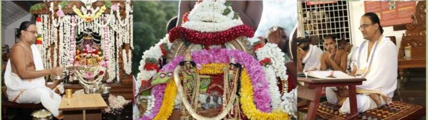
ஆகஸ்ட் 28 - செப்டம்பர் 6 - 2013 மதுரபுரி ஆஸ்ரமம் 20வது வருட ப்ரம்மேந்திரவரம்